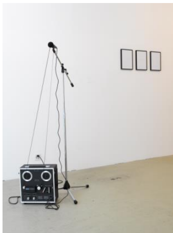
Pavel Büchler Lou Reed Live, 2008 Kunstmuseum Bern, Stiftung Kunsthalle Bern

La performance artistique, cette représentation éphémère limitée dans le temps, s'affirme de plus en plus comme un langage plastique de référence. À l'instar de l'ère numérique, empreinte de fugacité et saturée de torrents d'information et d'émotion, les performances artistiques immatérielles trouvent de nouvelles voies d'interprétation et de mise en scène de thématiques multiséculaires. Le Kunstmuseum Bern a fait de sa collection d'art contemporain la matière de cette nouvelle exposition, qui emprunte son titre, The Show Must Go On , à la chanson légendaire du groupe pop britannique Queen et met en lumière l'importance majeure que revêt le performatif dans la création contemporaine.