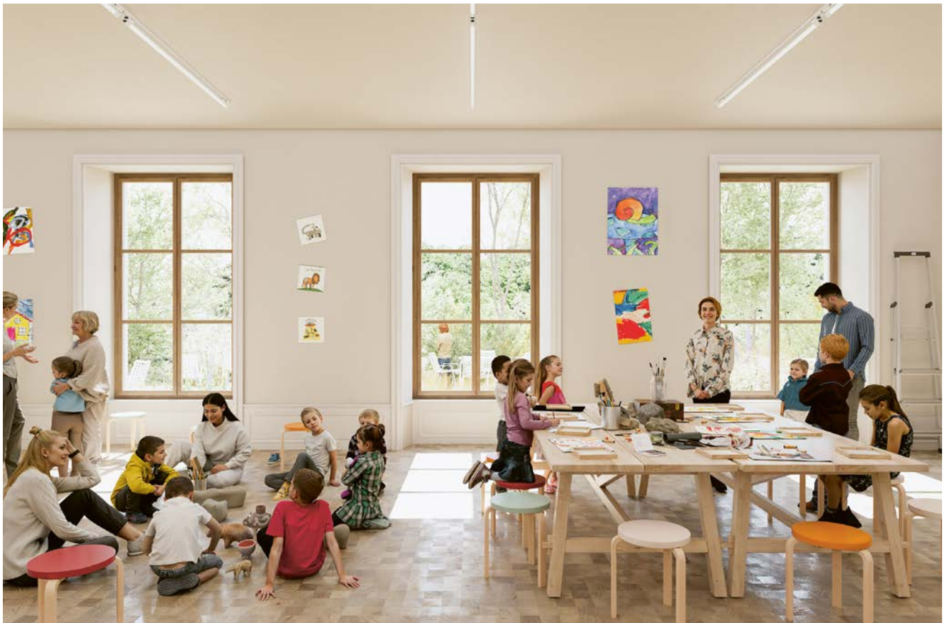
Bildnachweis: Renderings, Siegprojekt «Eiger», Visualisierung: Studio Blumen, Zürich, © Schmidlin Architekten